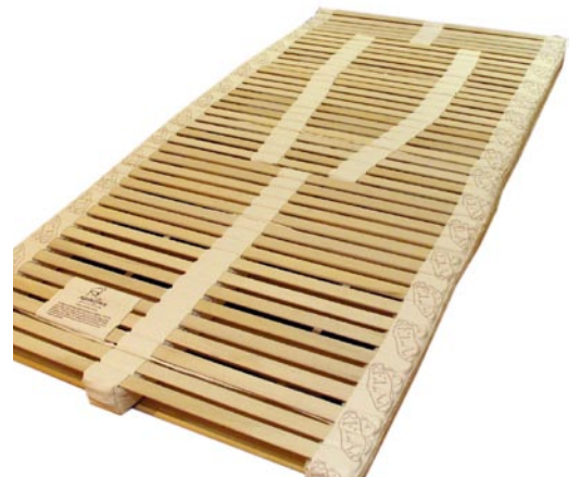
これがNaturflex。日本で弊社だけが直輸入しています。