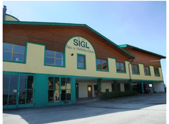
工場と事務所。昨年リニューアルしてきれいになっています