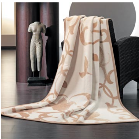
messina 3771 5,900 円

良いところばかり書きましたが、欠点もあります。軽く織られているために、使っていて少々毛玉が出ることがあります。洗濯はご家庭でも可能ですが、手洗いモードで、ネットに入れていただくようお願いいたします。