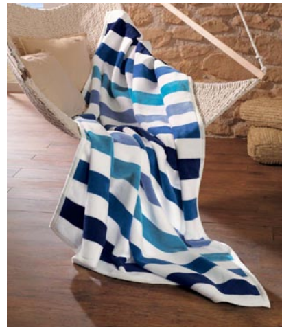
s.Oliver1412 9,800 円

価格は 4,980 円〜で中心価格帯は 7,900 ~ 9,800 円と、今時国産毛布でもなかなか無いリーズナブルプライスです。これも、商社を通さないドイツからの直輸入と、円高によって実現しています。ヨーロッパ製は安全面に厳しいので、その点でも安心です。