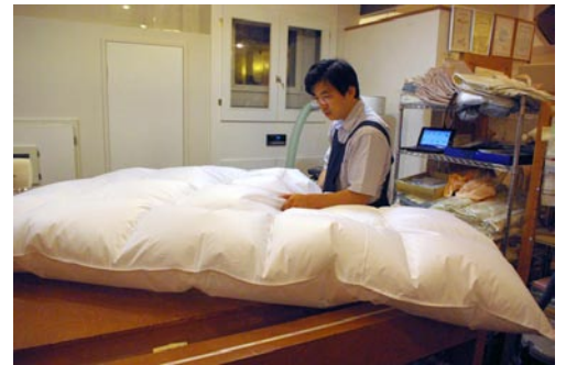
体質に合わせて中の量を調節しながら作る。

良い原料はダウンボール の成長が良いために、同 じ重量でも嵩が違う。 さらに絡みの強い羽毛は 保温性が良い。