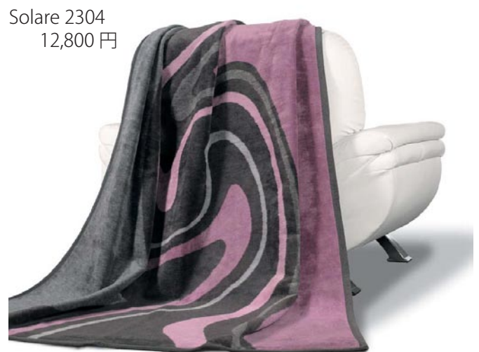
Solare 2304 12,800 円