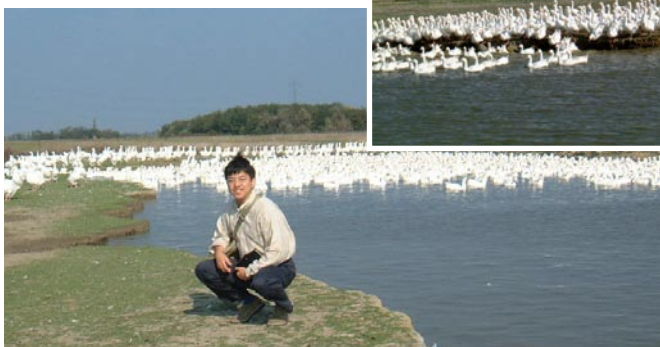
ハンガリーの良いほうの農場

はかせ まず羽毛は農産物だ、ということをお頭に置いておこう。するとどうなるかな？良い羽毛は良い生育環境から生まれるということだ。手間暇をかけて健康的に育てた鳥からは良い羽毛がとれる。だから、どの産地よりかは、どんな農場かという方が重要なんだ。ハンガリーで2つの農場を訪れたことがあるが、一方は鳥小屋の下に敷く藁は毎日のように替えて清潔にしていたし、もう一方はあまり管理が行き届いていないようだった。