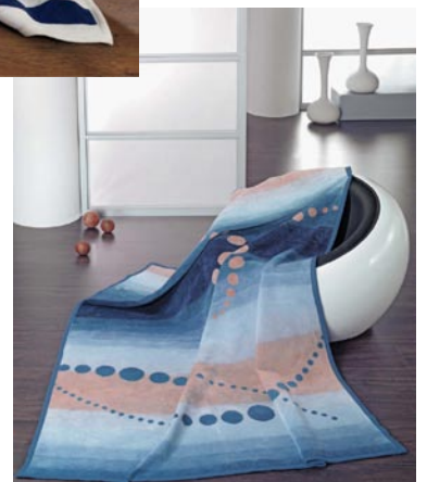
SORRENT1428 7,900 円